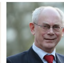
Herman Van Rompuy Politiker og tidl. premierminister i Belgien Taler